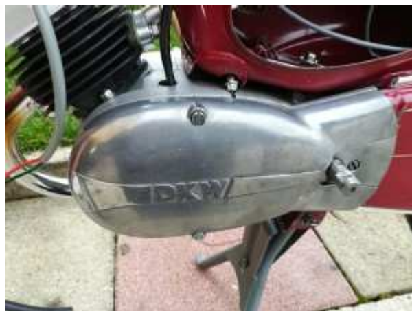
Motor der DKW Hummel