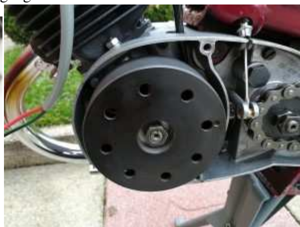
Motor der DKW Hummel

Setzen Sie den den Deckel zurück auf den Motor.