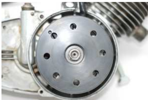
Motor der ILO

Verändert diese sich, wiederholen Sie den Vorgang bitte.