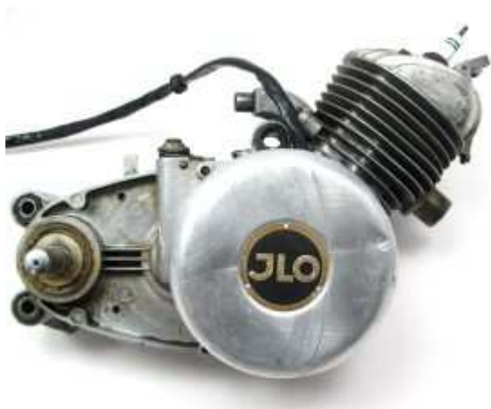
Motor der ILO