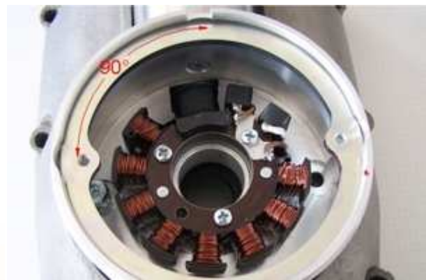
(Bilder zeigen Motor der Zündapp KS601)

Setzen Sie jetzt das neue Gehäuse auf den Motorblock. Befestigen Sie es dort mit den beiden flachen Schrauben M8. Keine Sorge auch wenn da vorher 4 Schrauben waren, die 2 halten das Gerät sicher.