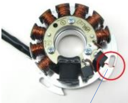
Foto zeigt eine Version, es gab verschiedene originale Anlagen

- Nehmen Sie die Passfeder vom Konus der Kurbelwelle mit einer Zange ab. Sie wird nicht mehr benötigt! Bitte nicht vergessen sonst müssen Sie die Lima später noch einmal herausnehmen. Keine Angst, die entfernte Passfeder hatte nicht die Aufgabe den Rotor zu sichern, sondern nur zu verhindern, dass er falsch angesteckt wird.